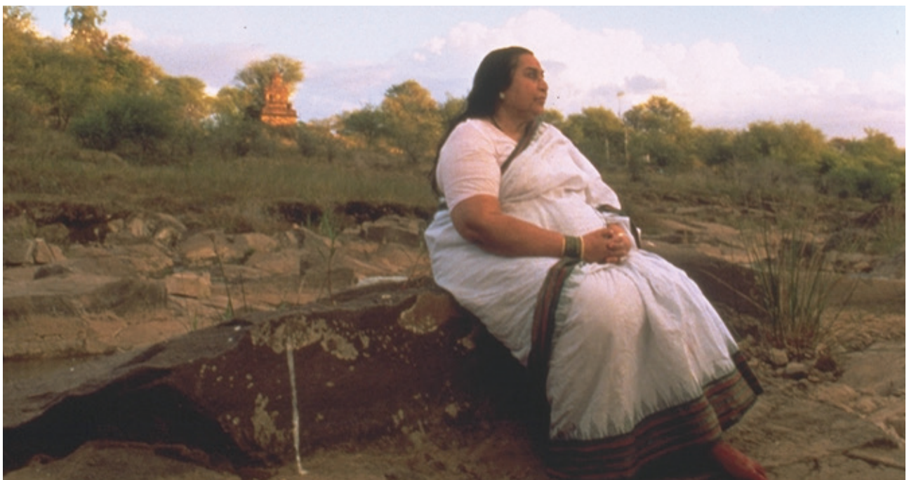
Počas pobytu si raz Šrí Matadží sadla na kameň na stranu kde prúd vody Nahani odteká.

Raz keď Šrí Adi Šakti prišla do Brahmapuri neskoro večer, požiadala jogínov, aby sa započúvali do melodického toku rieky Krišna, keď riečna voda prepadávala cez hrádzu Vasant Bhadra a