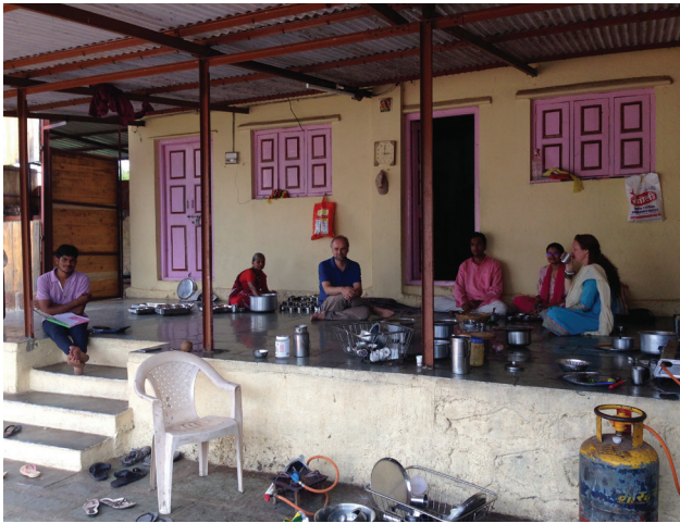
Pôvodná budova na mieste dnešného ašrámu. Dnes slúži na prípravu jedla.