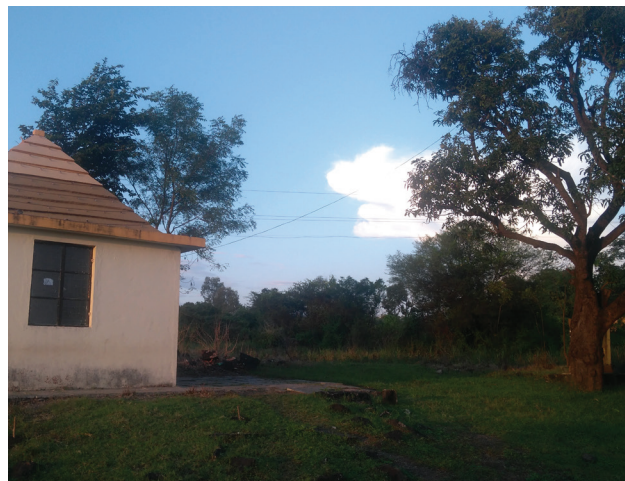
V decembri 1989 sa konala za prítomnosti Šrí Matadží pudža. Nachádza sa tu malý chrám Šrí Devi Bhavani.

kom a kameňom z príspevkov z oblasti obce Dhamner. Na tomto pozemku sa v decembri 1989 konala pudža za prítomnosti Šrí Matadží. Nachádza sa tu malý chrám Šrí Devi Bhavani. Pre zaujímavosť, jedno miesto nazývané Bhavani Mata Nahani (miesto, kde sa kúpala Devi Bhavani) sa nachádza vedľa koryta rieky, pod domčekom a je to miesto, kde bola Šrí Matadží uctievaná prúdiacou vodou rieky. Od miestnych obyvateľov sme sa dozvedeli, že ľudia sa sem chodia kúpať vo vode, ktorá tu nateká ako do vane, na tomto svätom mieste a hlboko veria, že táto voda vylieči každé kožné ochorenie. Stále sem niektorí prichádzajú kvôli uctievaniu a ponúkajú tu kvety a kokosový orech.