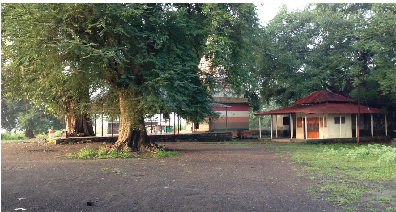
V januári 1985 sa v blízkosti chrámu Vitthala-Rukmini konala prvá pudža v Brahmmapuri.