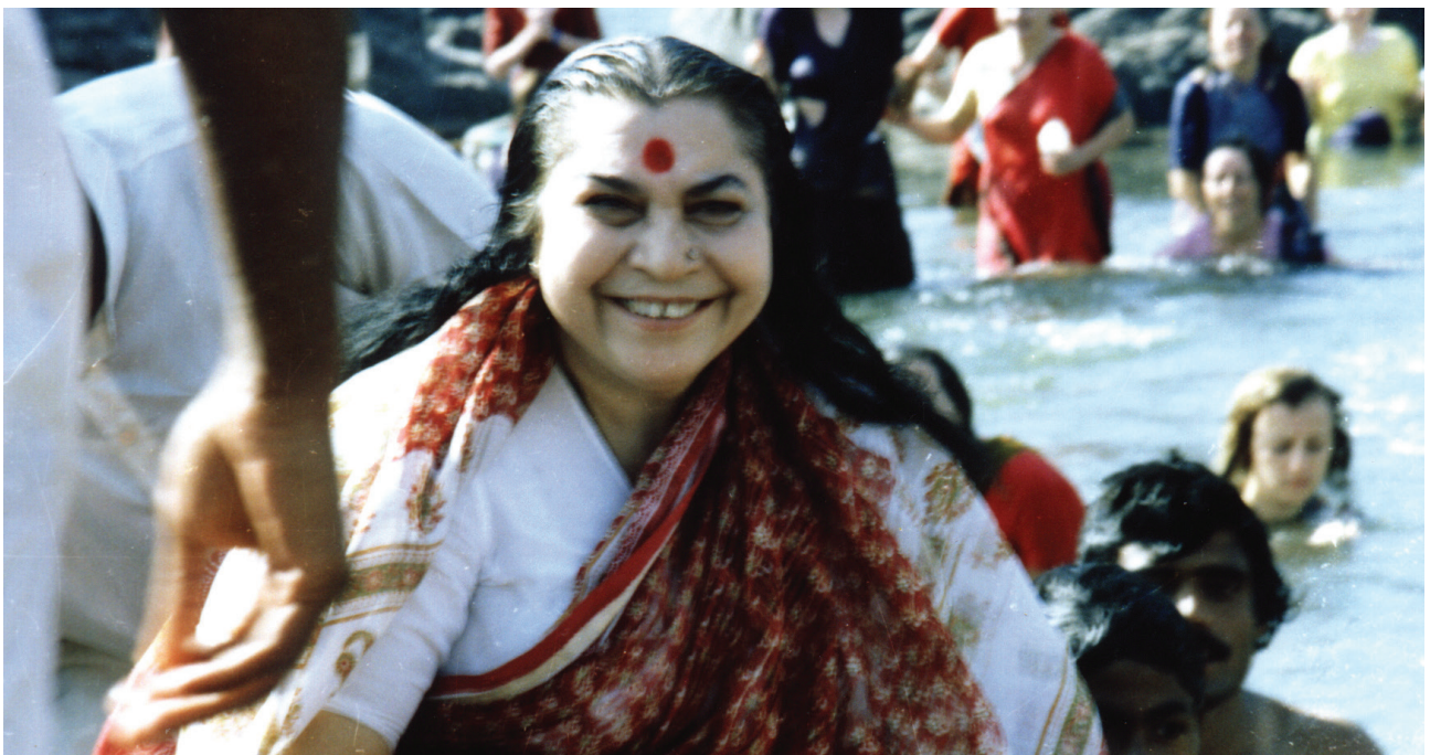
V roku 1985 Matka hneď v prvý deň vošla do rieky a posadila sa na kameň.

Keď Šrí Matadží počas Jej pobytu cestovala vo večerných hodinách do Brahmapuri a z Brahmapuri, upozorňovala na svetlo na horách a