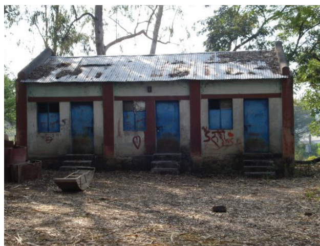
Domček pre dozorného priehrady, kde bývala Šrí Matadží v 80. rokoch

Brahmapuri je sväté miesto, výnimočne pozhnané Jej Svätosťou Šrí Matadží, nachádza sa na brehu rieky Krišna v okrese Satara v štáte Maharaštra. Západní jogíni sem prichádzali na tri dni každú zimu na prelomoch rokov od 1984/85 až do 1990/91. Požiadali ich, aby sa zastavili v Brahmapuri na osamelom mieste na brehu rieky s hustým porastom stromov a krovia ako v lese. V tomto čase sem prišla aj Jej Svätosť Šrí Matadží, bývala v obyčajnom domčeku pre dozorného, ktorý patril Úradu pre zavlažovanie v štáte Maharaštra.