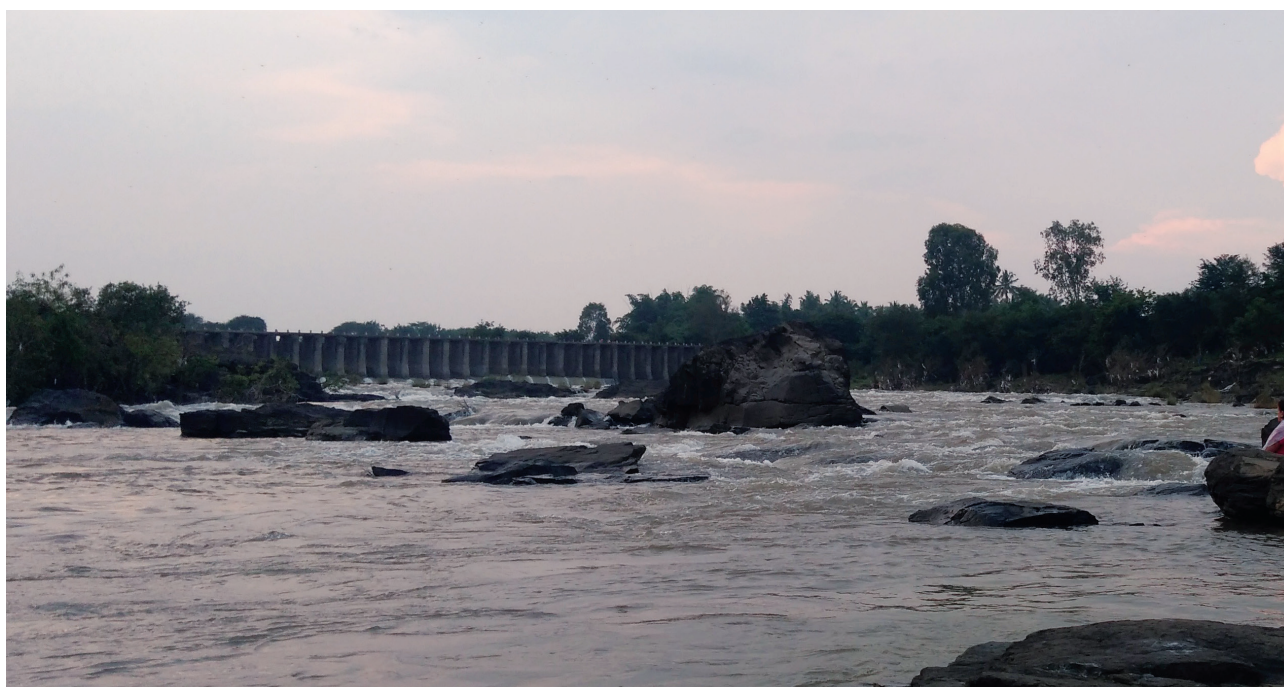
Priehrada s názvom Vasant Bandhara.

Hovorí sa, že už v dávnych dobách tu býva-