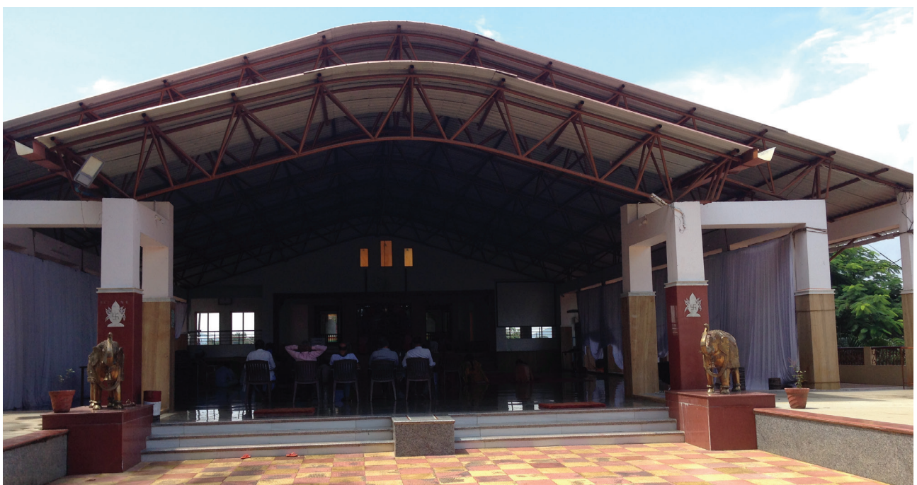
V suteréne Mandapu je postavených šesť izieb a jedna hala pre hostujúcich jogínov z iných miest India a zo zahraničia.

3) zakúpila aj ďalší pozemok o rozlohe 6578 m 2 na pravom brehu rieky Krišna presne oproti chrámu Sahasrar, ktorý chceme vybudovať. Tento pozemok susedí od severu so Šrí Šiva chrámom v obci Angapur. Táto strana brehu je vyššie položená od Šrí Šiva chrámu po Vasant Bandhara. Na tomto mieste navrhli, aby sa postavil chrám Anglai (Adnya) a Šrí Hanumana a ašram s domčekmi z bambusu obklopenými stromami a okrasnými a liečivými rastlinami. Okrem sahadžajogínskej meditácie bude