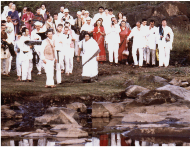
Jej Svätosť uctievaná prúdiacou riekou na rovnakom mieste v koryte rieky.

mnohokrát odkazovala na Pateshwar a poukázala na duchovný význam tohto miesta vo vzťahu k Adi Šakti. Z tohto dôvodu sme pátrali v histórii a zistili sme, že v staroveku sa v Pateshware konal Maha Yagya, ktorý zvolal kráľ Daksha Prajapati. Aj keď boli všetci Bohovia a Bohyne pozvaní na Maha Yadnya, kráľ nepozval svoju dcéru Bohyňu Sati a jej manžela Pána Šívu, pretože ho nepovažoval za vhodného manžela pre svoju dcéru Sati. Tým, že ich nepozval na túto ceremóniu, ich kráľ Daksha Prajapati urazil. Ale predsalen Bohyňa Sati prišla k otcovi na túto ceremóniu. Avšak jej otec sa k nej choval nenávisťne a jej manžela pri každej príležitosti urážal. Urážaná Bohyňa chcela vo svojej hrdo-